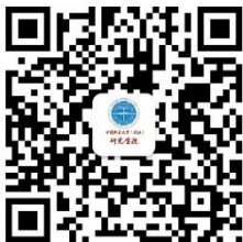
中国地质大学（武汉） 研究生院